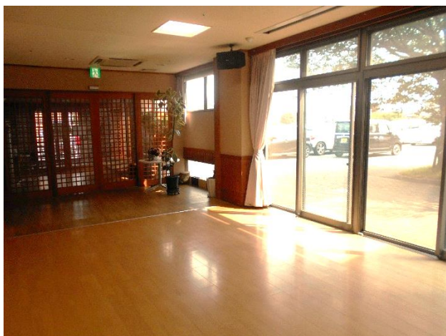
「1階地域交流スペース」 正面玄関先の大広間です。